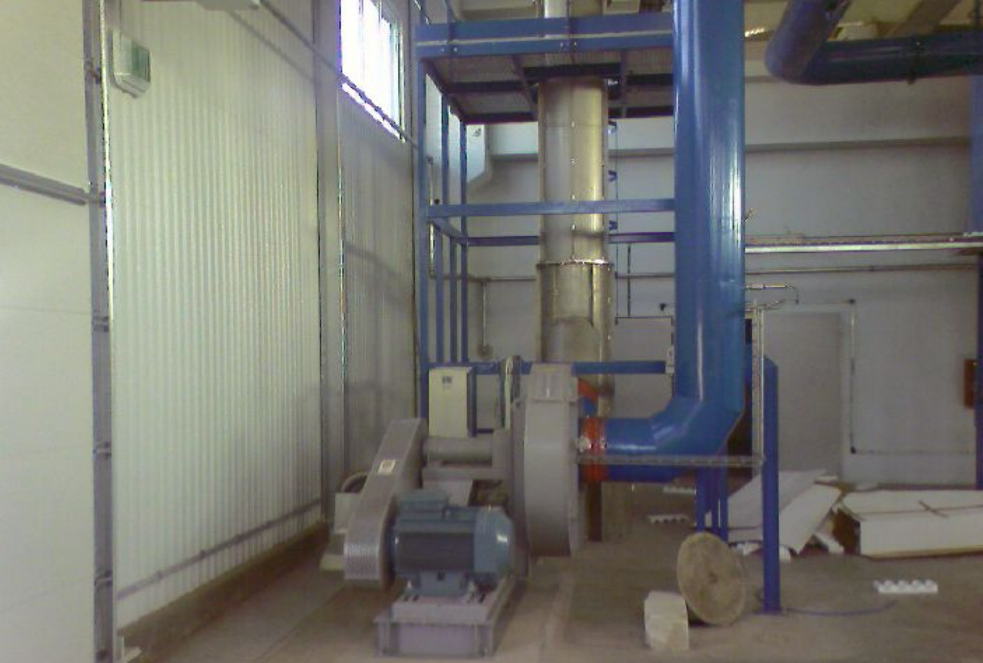
Sistemul de evacuare gaze