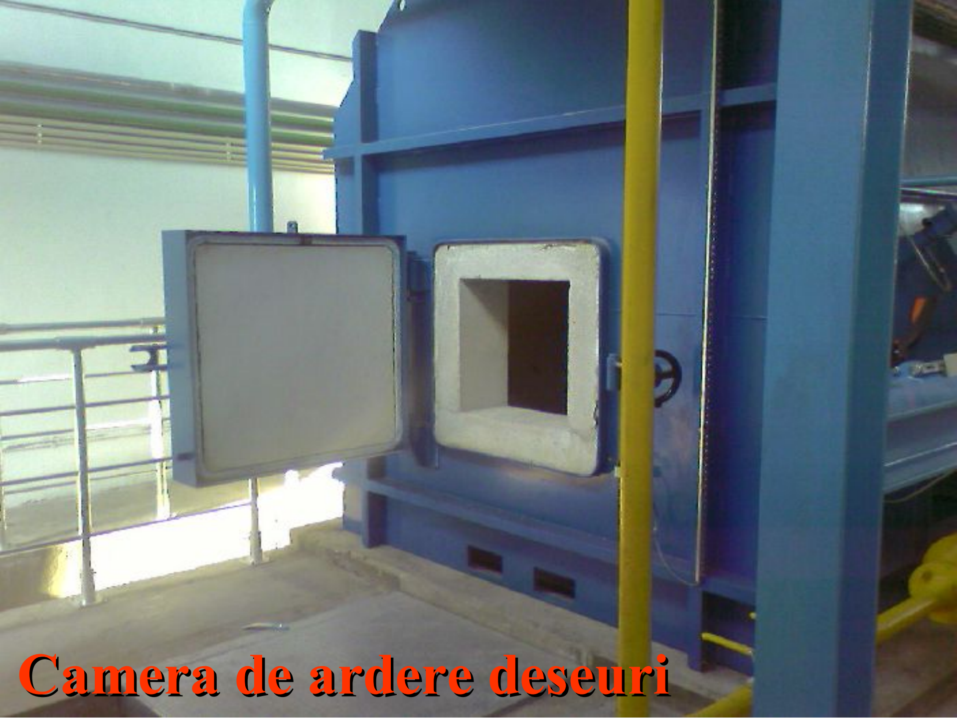
Camera de ardere deseuri